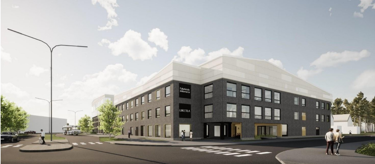
Oulu Juhlamarssi (impressie) – Oulu

Oulu Juhlamarssi zal gebouwd worden in een residentiële wijk in Oulu (209.000 inwoners). Het woonzorgcentrum is specifiek afgestemd op de noden van ouderen met hoge zorgbehoeften en zal een nieuwe thuis bieden aan 58 bewoners. Het is ontworpen en ontwikkeld door Hoivatilat. De bouwwerkzaamheden zijn recent van start gegaan en zullen naar verwachting in het derde kwartaal van 2022 worden opgeleverd.