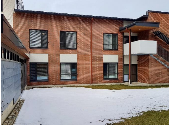
Ilkantie 1 – Kokkola

28 juni 2021 – na sluiting van de markten Onder embargo tot 17u40 CET