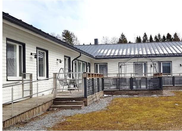
Metsämäentie 62 – Kokkola